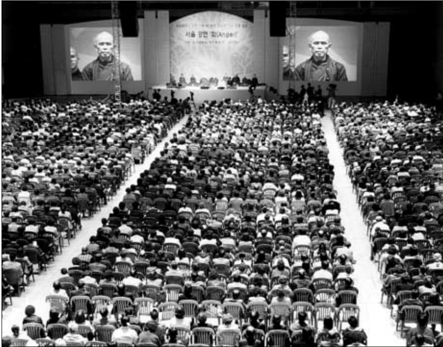
◇3월 20일 서울 코엑스컨벤션홀에서 열린 '화' 강연.

틱낫한 스님이 3일 이화여대 강연을 끝으로 두 번째 공식 방한일정을 모두 마치고 4일 출국했다. 스님의 이번 방한을 앞두고 본지(404·413호 참조)를 비롯한 여러 언론매체에서 '출판 상업주의'를 우려했었다. 또한 외국 스님들의 잦은 방한에 비해 한국불교의 문제점을 지적하기도 했다. 그런 한편으로 한국에도 틱낫한 스님 이상의 스님이 많다는 사실을 확인했다. 하지만 그 스님들의 회향 방식에 대해서는 반성적 질문을 할 수밖에 없는 실정이기도 하다. 따라서 스님 방한에서 나타난 몇 가지 문제점을 짚는 것은 오늘의 한국불교에 대한 반성적 점검도 될 것이다.