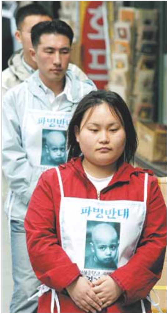
◇3일 청년불자들이 반전평화대행기시위를 하고 있다.