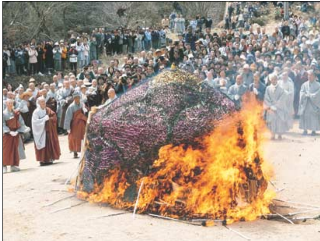
◇서암스님 대비식이 5천여 사부대중이 운집한 가운데 2일 봉암사에서 '수좌장'으로 열수됐다.

여거(如去)라는 말은 여래실호 중 하나인 선서(善逝)라는 말과도 통한다. '잘 가는(善逝) 이' 즉 미혹의 세계를 능히 뛰어넘은 사람을 일컫는다. 서암 스님은 바로 그런 삶을 온몸으로 보여 주었다. '바람' 하나면 육신을 위한 일체의 살림살이가 수습되는 '운수(雲水)'의 삶으로,