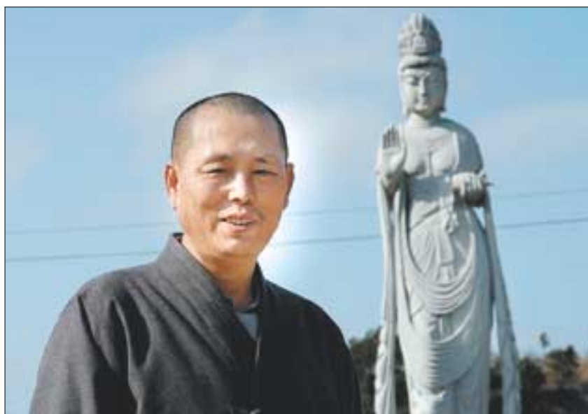
탄정스님은 생사를 넘나드는 순간마다 관세음보살과 지장보살의 현몽을 꾸어 어려운 고비를 넘겼다고 한다.