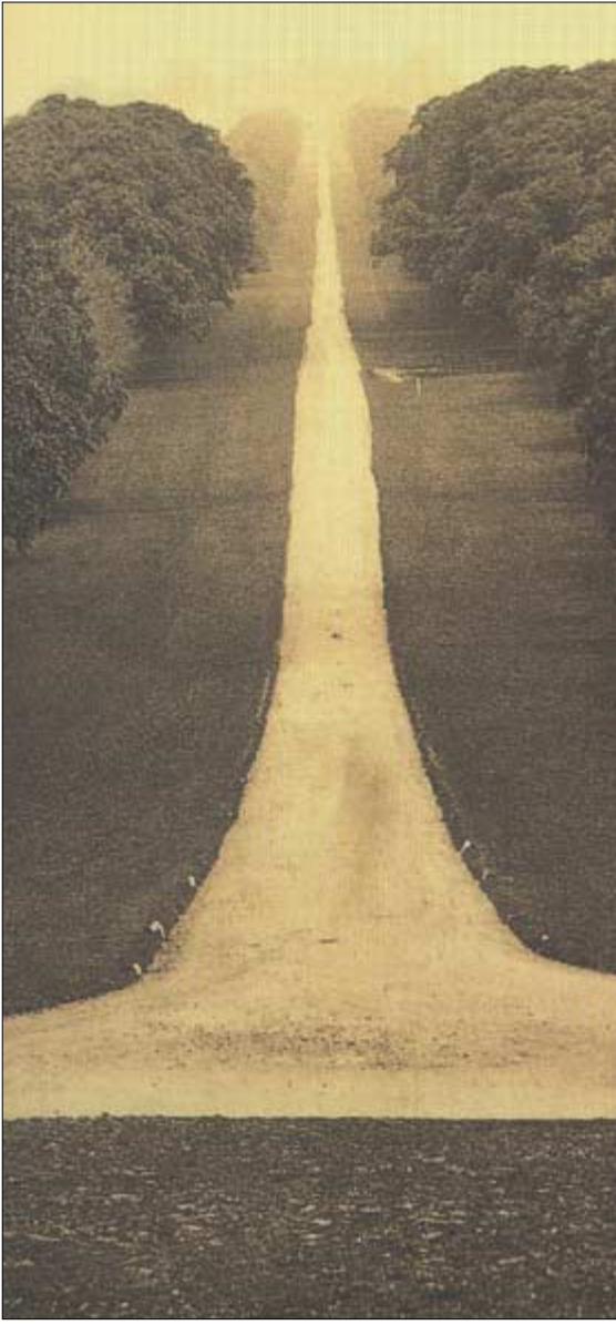
◇길은 끝이 없다. 길을 걷는다는 것은 새로운 세계와의 만남이자, 그 세계의 모습과 문화를 재창조하는 방식이다.

<영혼의 해부>는 조금은 낯선 직관의학이라는 새로운 분야에 대해 이야기한다. 직관의학이란, 해부학과 직관, 몸과 마음, 영혼과 에너지에 대한 것이다. 미국의 케롤라인 미스 박사가 이 분야에 대한 지난 14년간의 연구 결과를 이 책에서 요약했다.