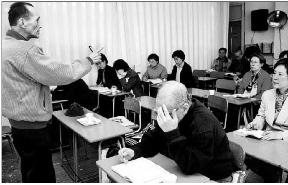
◇간경은 부처님 법신과 하나되는 수행법으로 경전의 내용을 마음으로 읽고 그대로 실천하는 것이 중요하다. 3월21일 서울 견지동 보림회강의실의 교육 장면.

참선수행이 내 가치관과 삶을 바꿔 놓았듯이 부처님의 가르침이 학교 교육발전과 청소년 인성개발에 이바지 할 수 있는 가능성은 무궁무진하다고 확신한다.