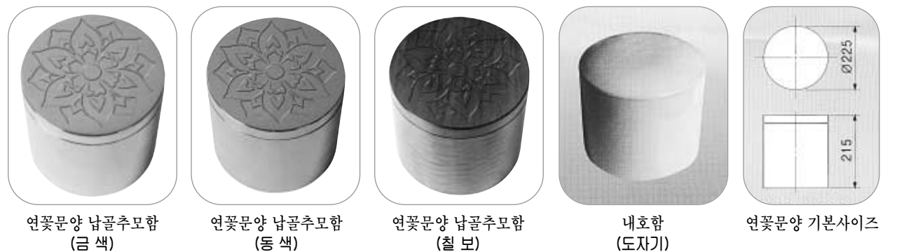
연꽃문양 납골추모함 (금색)