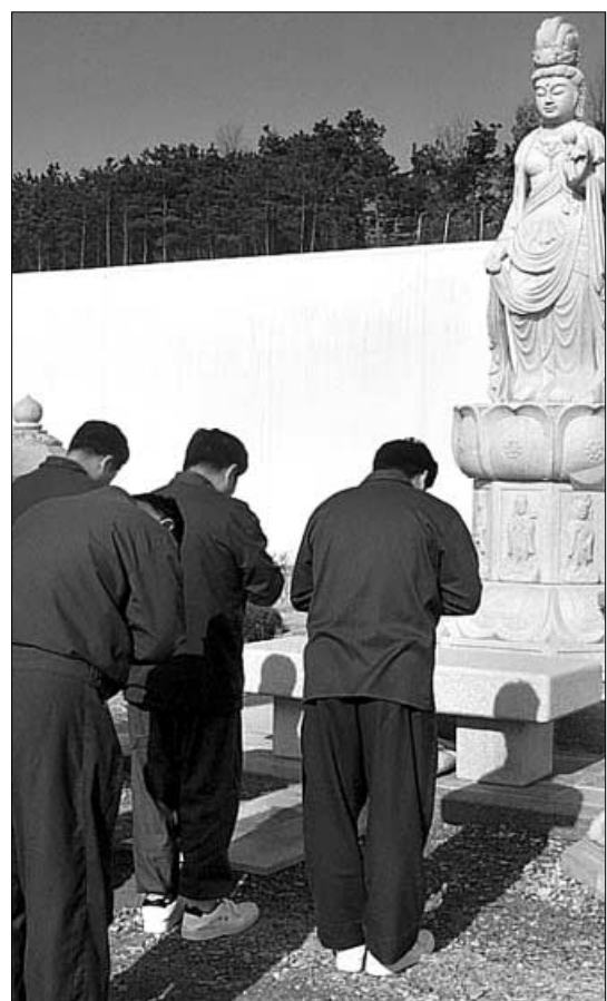
◁"지장보살님, 지장보살님" 지난 19일 여주교도소 불자재소자들이 교도소 운동장에 봉안된 4M 높이의 지장보살상 앞에서 참불자로 다시 태어나기를 서원하고 있다.

지장보살의 중생 구제 원력, 관세음보살의 자비심, 문수보살의 지혜... 최근 직장불자회가 보살사상에서 신행의 뿌리를 찾고 있다. 또 직무 특성에 따른 직장불자회