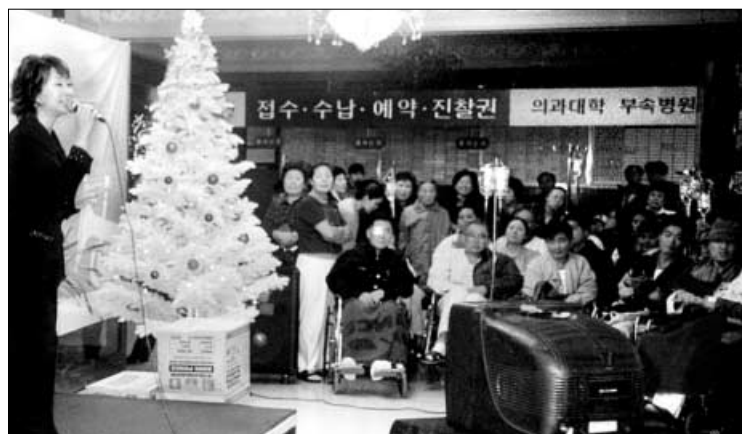
◁지난해 12월 대한불자가수회가 경희의료원불자회와 함께 개최한 '환자를 위한 작은 음악회'에서 불자가수가 노래를 부르고 있다.

사실 그간 굵지 않은 시선도 있었습니니다. 우리 불자가수회를 사찰에서 물론 판매행위를 조정하는 단체로 취급하는 경우도 적잖았습니니다. 그야말로 오해 아닌 오해를 많이 받았었지요. 또 어려움도 많았습니니다. 인기가수와 비인기가수의 정서적 견해 차이였죠. 그러다보니 창작 활동 회원이 40명밖에 안되는 결과가 초래되기도 했었죠. 하지만 우리 불자가수회는 이렇수록 더 열심히 정기법회를 열고, 보다