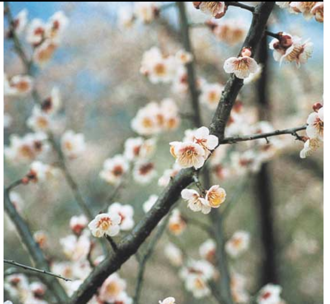
◀섬진강변에 만개한 '매화'.

“ 마당 빼곡한 2천여 장독 자체가 볼거리 ‘취화선’, ‘흑수선’ 등 영화촬영 단골무대 쌍계사·칠불사 가면 마음에 법향 가득 ”