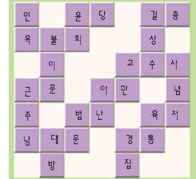
< 413호 「교리퍼즐」 정답 >

2. 북한산국립공원의 도봉산 선인봉 남쪽에 위치한 사찰. 무문관으로 유명함. 3. 다섯 종류의 관법(法)을 의미. 진관, 청정관, 광대지혜관, 비관, 지관을 말하는 것. 5. 산스크리트어인 Amie의 음역으로 영원하신 부처님이라는 뜻. 대승불교의 중요한 부처님으로 무량수불이라고도 불림. 6. 수행승이 먹어도 되는 97가지 고기라는 뜻. 나를 위해 죽이지 않는 고기. 전에 벌써 죽은 고기 등. 7. 중국에서 불해 서쪽에 있는 천축국의 의미로 인도도를 말함. 9. 신라제 24대 왕으로 흥륜사와 황룡사를 창건. 유적으로는 영토확장을 기념하기 위해 세운 4개의 순수비 가운데 국보 3호 북한산 순수비와 33호 창녕 순수비가 유명하다. 10. 세상의 소리를 본다는 의미. 11. 의복, 음식 등 물질적인 재물을 타인에게 베푸는 것.