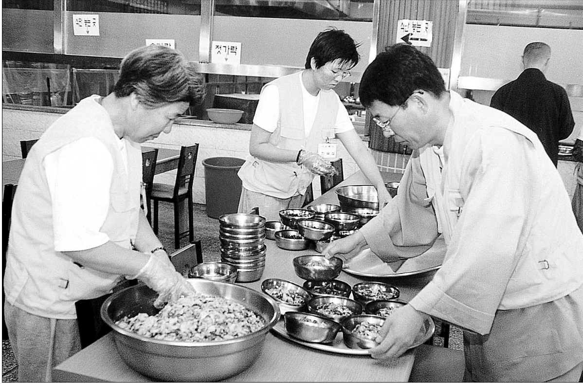
◇수련회 유형형 자들로 구성된 사찰 자원봉사팀. 사진은 지난해 7월 열린 해인사 사찰수련회에 서 점심공양을 준비하고 있는 모습.