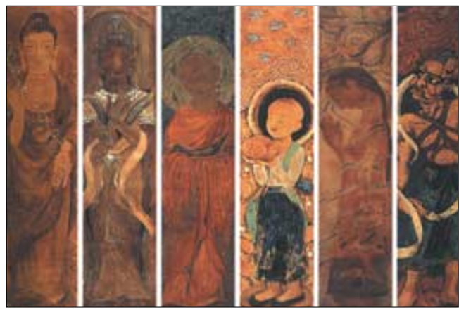
◇나무판에 칠화중합기법을 사용해서 그린 정재희씨의 '마음의 정원'.

그래서 나무판과 천, 아크릴 등 다양한 캔버스위에 전통칠에기법을 사용하며 입체적