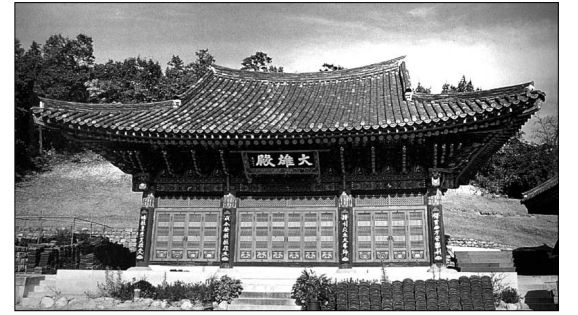
현재의 건봉사 대웅전. 1950년 6·25전쟁 때 소실된 것을 94년 복원했다.

건봉사는 위치적으로 남한의 최북단에 위치하고 있으며, 석가세존의 진신처이사리를 봉안하고 있다. 758년 염불만일회의 호시이자 정토불교의 본산으로 나무마타 불 육자염불송이 끊이지 않는 곳이다.