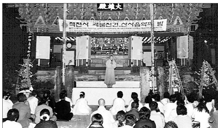
사진은 지난해 10월 청도군청 불자회가 경북 청도군 적천사에서 주최한 ‘과불천경 및 산사음악회’ 공연 모습.

둘째 주 토요일에 청도군 관내 12개 전통사찰을 순회하는 법회를 봉행했지요. 자연스럽게 지역 사찰을 이해하고, 여러 스님들의 법문을 들을 수 있는 좋은 기회였습니다. 이번이었던가요? 철야정진기도는 물론 2001년 8월에는 강화도 전등사를, 지난해 1월에는 제주도 약천사를 찾아가셨습니다. 간절히 기도를 올렸지요.