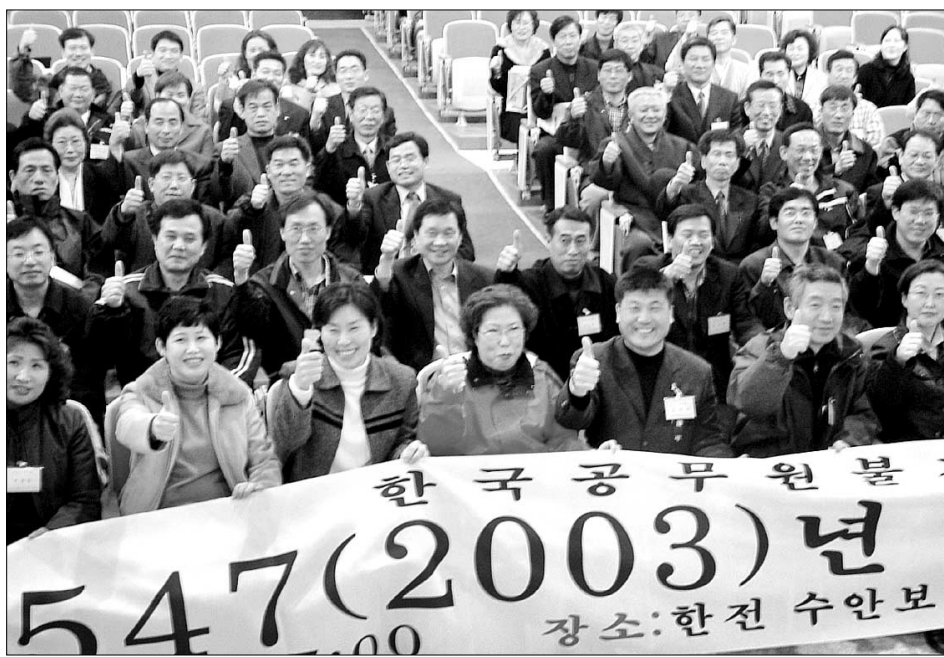
2월 22-23일 이틀간 총무 한전연수원 대강당에서 참가한 한국공무원불자연합회 단위기관불자회 80여명의 총무들이 2003년도 사업 계획을 확정하고, 공불련 활성화를 다짐했다.

‘사회봉사의 날’도 제정된다. 매년 10월 말경 전국의 205개 단위기관불자회가 일제히 인근 지역에서 사회봉사 활동을 펼친다. 공불련의 ‘사회봉사의 날’ 제정은 산발적으로 진행돼온 지역별 단위기관불자