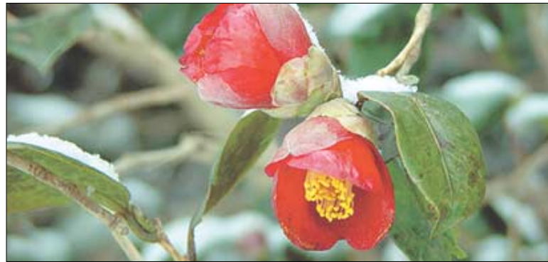
◇해남 미항사에 활짝핀 동백.

동백꽃은 한 겨울에 있을 열 봄에 만개한다. 그래서 동백꽃 여행은 겨울에서 봄으로 옮겨가는 나들이다. 여수 오동도, 해남, 남해, 거제도 등 바닷가 인접 지역에서 이미 꽃망울을 피어올렸고 만개 정도는 60~70%정도. 절정 시기는 이달 중순까지. 또다른 동백꽃 명소인 전북 고창 선운사는 이달 말에 꽃이 피 4월 초까지 이어질 전망. 여수 오동도와 돌산도의 향일암은 요즘 동백꽃을 감상하려는 봄나들이객들로 붐빈다. 오동도는 5,000여그루의 동백이 섬 전체를 빨갛게 채색했다. 동백나무 후박나무 소나무 등이 울창한 섬 일주 산책로엔 숲을 스치는 바람소리와 동백새 우는 소리가 어우러져 정취를 더한다. 오동도는 바다풍광이