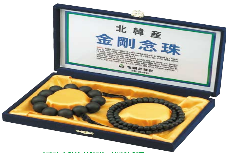
2가지 소원이 성취되는 신비의 염주