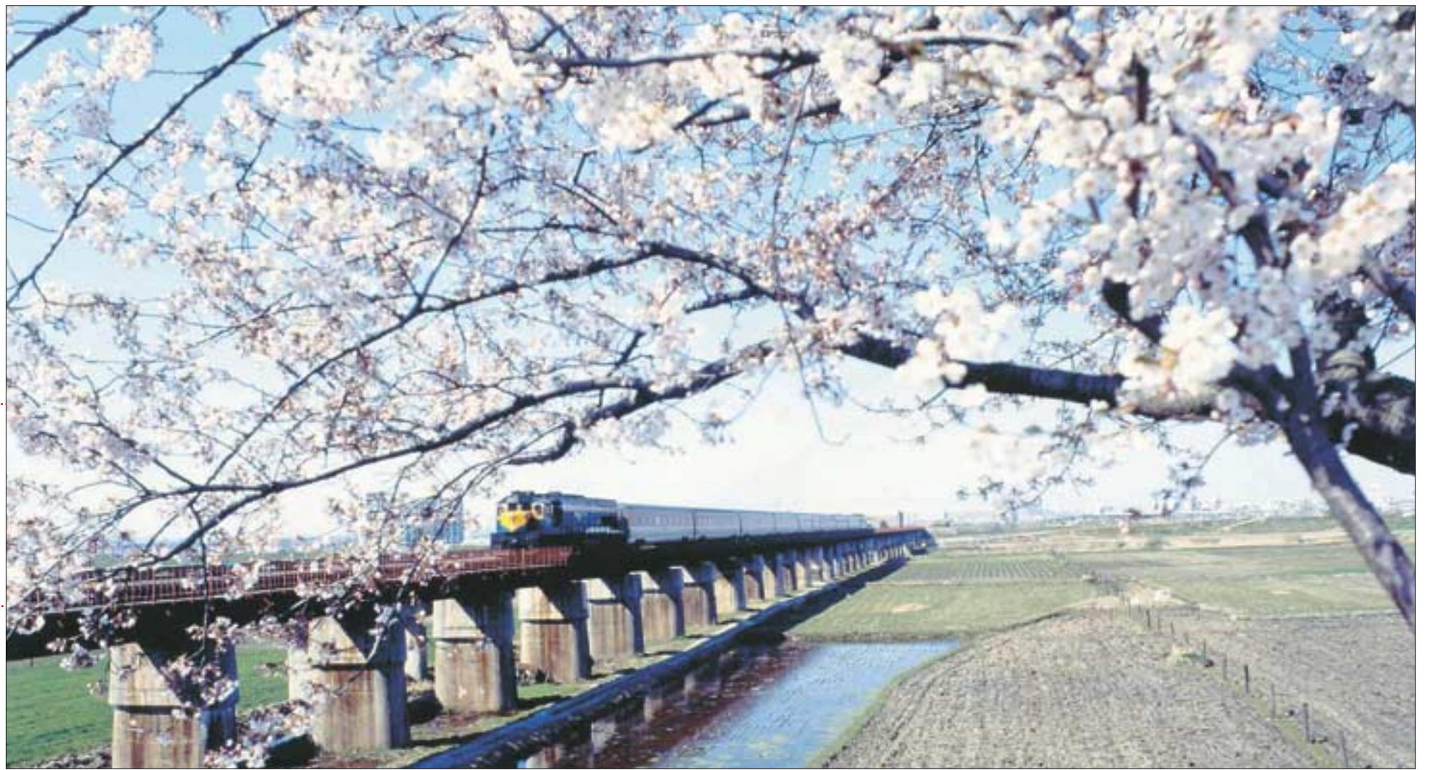
◇올해도 꽃소식과 함께 철도청은 3-4월 꽃놀이 열차를 운행한다. 벚꽃이 흐드러지게 핀 들뜬 가로질러 봄꽃열차가 힘차게 달리고 있다.

남쪽으로부터 꽃소식이 들려온다. 동백꽃은 남해 바다를 빨갛게 물들였고, 매화꽃도 차츰 북쪽으로 걸음마를 띄우고 있다. 이달 중순부터 4월초에 걸쳐서는 동백, 매화, 산수유, 벚꽃 등 봄을 대표하는 꽃들이 앞다퉈 꽃봉오리를 활짝 열 예정이다. 이에 철도청과 여행사에서는 봄꽃 군락지와 봄꽃이 흐드러지게 피어 있는 산사를 연계한 '봄꽃여행 상품'을 활발하게 내놓고 있다. 주말 교통혼잡 때문에 집 나서기를 주저하는 이들에게 매우 유용할 듯 싶다. 올봄부터 봄꽃이 어우러진 산사에서 부처님의 법화와 봄기운을 마음껏 마셔보자.