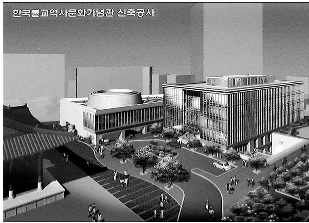
◁올해말 완공될 조계종 새 청사 조감도. 조계종은 새 청사 시대와 더불어 변화를 꾀하고 있다.