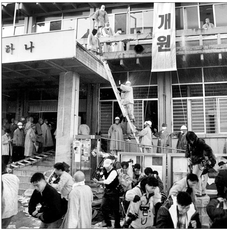
◁현 총무원장사에서 총무원장 선출 둘러싸고 벌어진 98년 종단사태 모습.