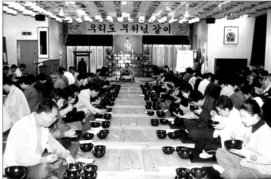
불교대학 이원화 체계가 굳어지면서 불자교육과 포교에 혼선이 우려되고 있다. 사진은 올해 1월 열린 모 불교대학 신입생들의 발우공양 모습.

연합회는 "무조건 조계종에 맞추어 따라오라고 주장한다. 조계종은 '신도교육법'을 제정하면서 신도교육을 기본-전문-지도자-재교육 체계로 정하고 종단에 독특한 불교대학을 전문교육 기관으로 지정했다. 또한 전문교육기관 인가를 받지 않으면 포교사 고시 응시자격을 제한받기 때문에 졸업생들의 활동 무대를 열어주기 위해서라도 자체 포교사 고시를 실시할 수 있는 체제를 갖출 수밖에 없으며, 연합회