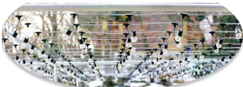
* 시공된 연등용 전선 케이블 *