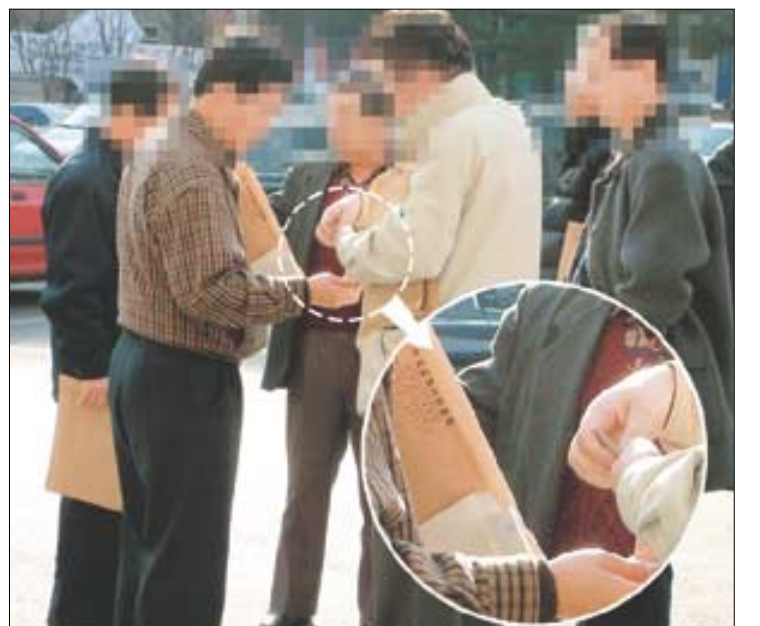
▷한국교통시민협회 주최 '서울외곽순환도로 공사추진 공청회'가 끝난 뒤 교통시민협 관계자로 보이는 사람이 동원된 사람들에게 돈을 건네주고 있다.