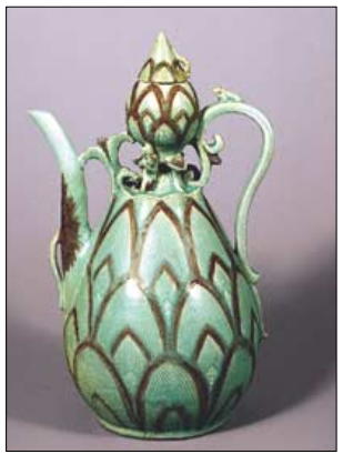
◇청자진사채 연화문 표형주자.