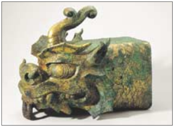
◇전각지붕 추녀끝에 끼우는 용(龍)모양의 장식물인 금동 용두토수.