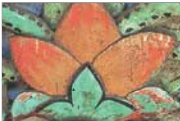
◇정수사 대웅보전 어칸 꽃문.