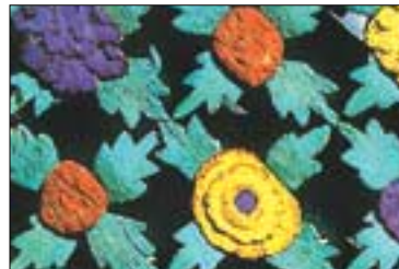
◇신흥사 극락보전 왼쪽 축문 꽃문.