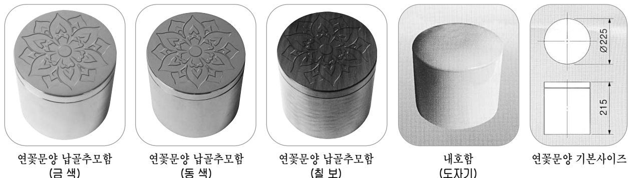
연꽃문양 납골추모함 (금색) 연꽃문양 납골추모함 (동색) 연꽃문양 납골추모함 (철보) 내호함 (도자기) 연꽃문양 기본사이즈