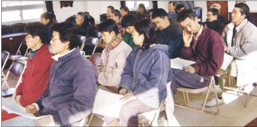
한생명에서 실시한간담회에서 산내면 주민들이 사업내용을 듣고 있다.