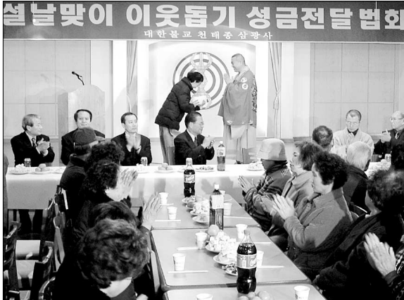
◁부산 삼광사가 1월28일 어려운 가족 100세대에 성금 1천만원을 전달했다.