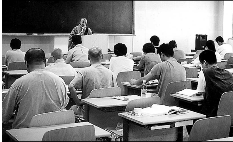
◇지난해 7월 김포 중앙승가대학에서 조계종 총무원 주최로 열린 '제1회 종무행정 간담회'. 바람직한 재가 종무원 교육제도로 평가받고 있다.