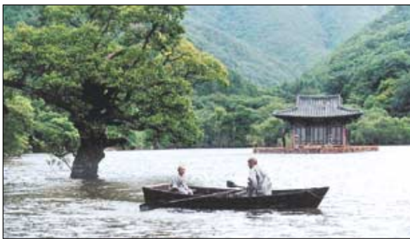
◇김기덕 감독의 영화 '봄 여름...에서 한여름에 동자승과 노승이 나룻배에서 대화하고 있다. 뒤에 암자 세트가 보인다.