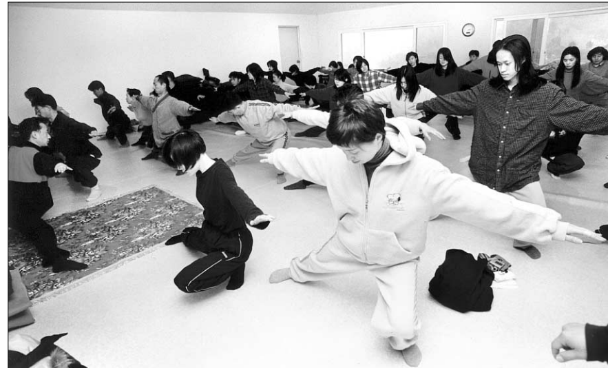
<17일 한국요가연수원 양평 수련장에서 열린 2박3일간의 집중수련회에서 회원들이 하타요가의 아사나를 행하고 있다.>

의식을 하나의 대상으로 집중시키는 삼매를 통해서 초월적 자아를 현상적 자아로부터 분리(獨存)시켜 절대성과 결합시키는 기술인 것이다. 특히 요가 수행을 통해 인간 생명이 우주와 더불어 영원한 것이 되고, 인간 존재가 우주적인 것으로 확대되는 체험을 '범아일여(梵我一如)'라고 한다.