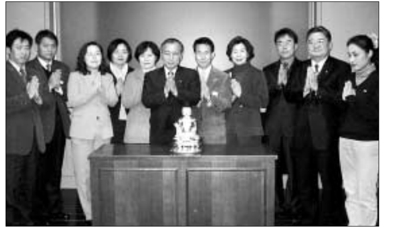
◇ '부처님 닮기를 서원합니다' 한국은행 불교회 회원들이 두손을 모으고 있다.