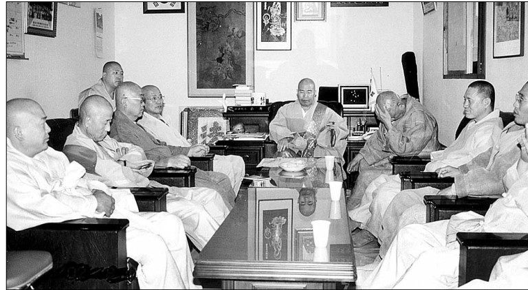
◇총회장은 6일 남양주 총무원에서 신년하례법회를 봉행했다.