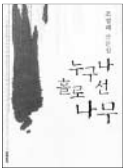
‘누구나 홀로 선 나무’ 조정래 지음 문학동네 / 9천5백원

4부 왜 문학을 하는가는 작가로서의 조정래의 모습을 읽을 수 있는 장이다. '누명(陋名)'이라는