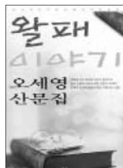
‘왈패이야기’ 오세영 지음 화남 / 9천원

인의 삶과 인생, 사랑, 그리고 대자연과의 아름다운 친화를 다룬 총 53편의 산문이 모두 4부로 나뉘어져 실려 있다.