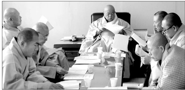
◇원용종은 6일 총무원에서 정기중앙총회회를 열고 새해 사업계획을 확정했다.

님을 비롯해 총무원장 법륜스님 등 종단간부와 종진스님 50여명이 참석한 가운데 사무식 및 신년하례회를 봉행했다. 새로 선출된 전남총무원장 진운스님에게 임명장을 수여했다. 이 자리에서 종정 일공스님은 "종단과 한국불교의 발전을 위해 종도들의 원력을 모아 나갈 것"을 당부했다.