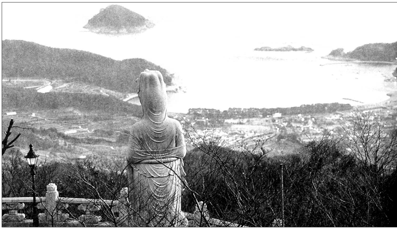
◊남해 보리암은 망대(望臺)라 부르는 금산 정상상의 바로 아래 암벽 기슭에 터를 잡았다.