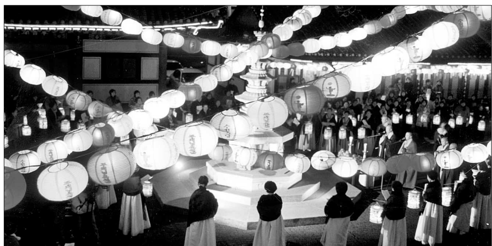
수원포교당 불자들이 성도절 전날인 9일저녁 금강보탑 주변을 돌며 뭇중생들의 깨달음을 서원하고 있다.

서울시유형문화재 161호로 지정된 금선사 신중탱화는 서울지역 사찰에 남아있는 가장 오래 된 신중도 가운데 하나이다. 권형진기자