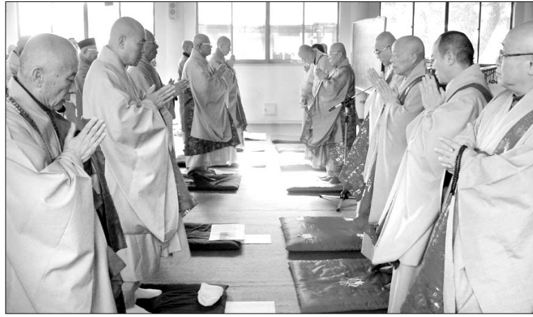
◇불교계 각 종단들은 각각 신년하례 및 시무식을 열고 제1년 새해를 열었다. 조계종 시무식(위)과 태고종 신년하례법회(아래).