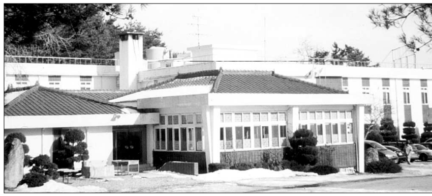
◊낙산사가 3월 인수하여 불자수행 및 요양기관으로 활용할 낙산유스호스텔 전경.

경내 빈터에 꽃밭·자전거 일주로 개설 40실 규모 콘도형 펜션 건립도 추진