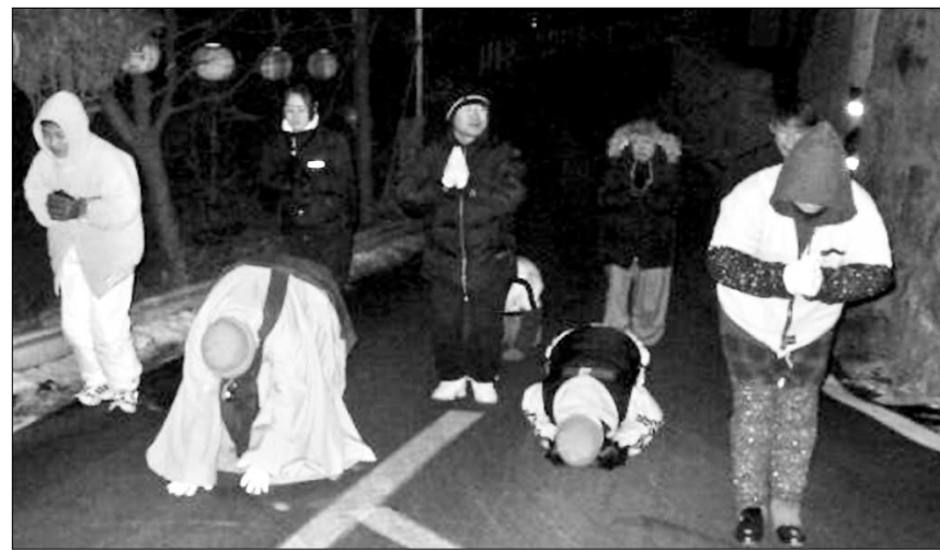
◊양주 대원정사 신도들이 12월31일 약 1km 거리를 1보1배 정진하고 있다.

리조트형 사찰모델. 펜션에서는 지난해 6월부터 시작해 4,000여명이 다녀가는 등 큰 호응을 얻은 바 있는 1박2일 사찰 체험 프로그램인 '산사의 하루'를 운영할 예정이다. 가족들이 산사에서 새벽에 불부터 참선 공양(식사) 올력(경내 청소)