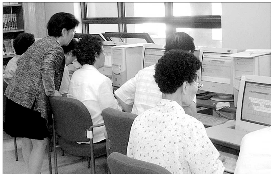
◇복지관이나 자치단체가 마련한 컴퓨터교실에 인터넷 사용법을 배우려는 노인들의 발길이 줄고 있다. 도봉노인종합복지관에서 컴퓨터를 배우고 있는 노인들.

초고속 인터넷 보급률 세계 1위, 인터넷 사용자수 1천670만명. 초등학교부터 노인들까지 이메일을 주고받고 인터넷에서 자료를 검색하는 것은 이제 일상이 됐다. 자치단체나 복지관에서는 '노인 컴퓨터 경진대회'가 잇달아 열리는 등 노인 인터넷 사용자 수가 날이 증가하고 있다.