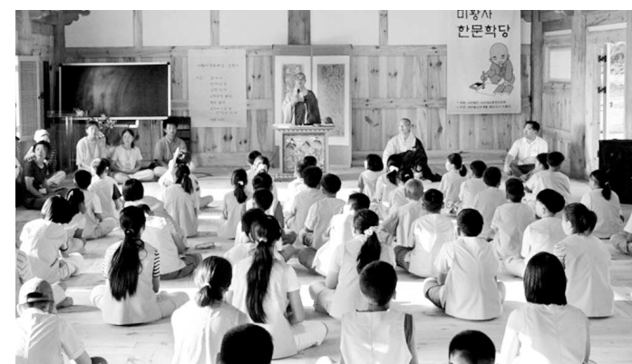
◇지난 여름방학 해남 미황사에서 열린 한문학당 입제식 모습.

겨울방학을 맞아 아이들이 한문과 사찰예절을 함께 배울 수 있는 한문학당이 문을 열었다.