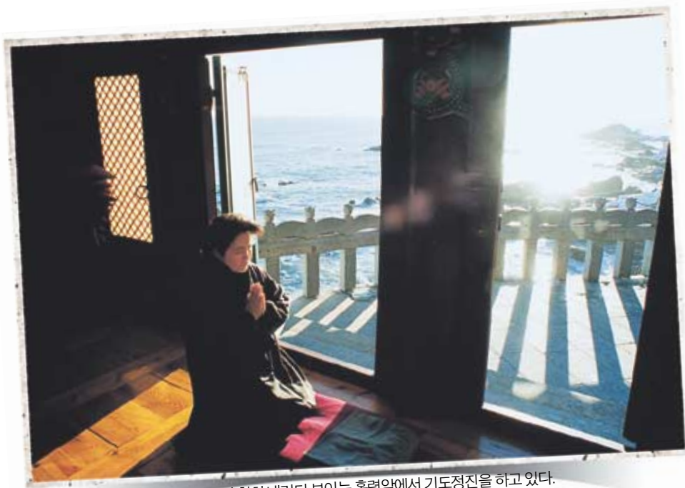
동해바다를 훤히 내려다 보이는 흥련암에서 기도정진을 하고 있다.

관음기도도량 낙산사 흥련암 동해의 일출이 절경인 해안절벽 의상대. 거기서 지척인 흥련암(왼쪽사진)은 남해 보리암, 강화 보문사와 더불어 관세음보살이 현신한 한국의 3대 관음 성지중 하나다. 특히 흥련암은 삼국유사에 기록된 의상과 원효 두 스님에 관한 이야기를 통해 관세음보살의 진신이 머무는 곳으로 알려져 있다. 이 곳을 찾으면 으레 누구나 한 번쯤 범당 안을 두리번거리게 된다. 마룻바닥 어딘가에 뚫려진 '구멍'을 찾아서다. 길이 8cm 정도의 정사각형 구멍. 뚜껑 열고 들여다보았다. 깊이가 10m쯤 될까. 암자 아래 좁