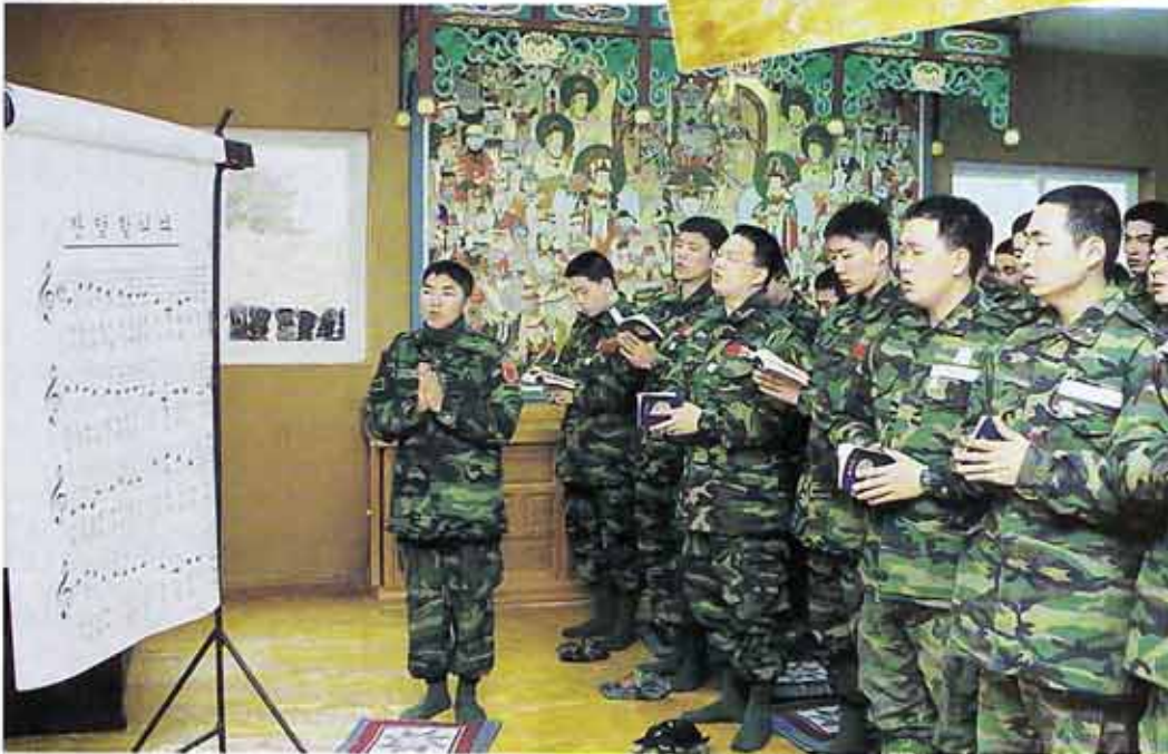
○마주보고 있는 교회에는 밴드와 피아노등을 갖추고 있음에도 승리부대 종교센터내 법당은 피아노조차 없어 장병들의 찬불가 소리가 제각각이다.