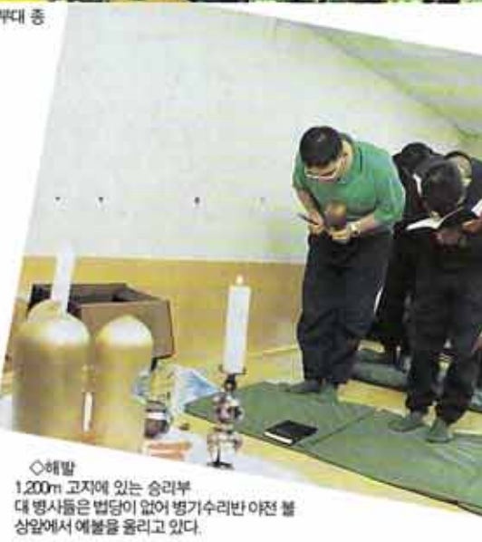
◇해발 1,200m 고지에 있는 승리부대 병사들은 법당이 없어 병기수리반 아전불상 앞에서 예불을 올리고 있다.

강원도 철원군 근남면 ○연대 법당 10일 오전 8시 50분, 강원도 신악에 자리 잡은 군부대에 여는 지역보다 일찍 찾아온 영하의 추위에도 어랑곳하지 않고 법회에 참석하기 위해 장병들이 법당으로 모여들었다. 살을 에는 듯한 때서도 비람을 피해 병사들은 손실감이 법당으로 들어왔다. 그러나 변변한 난방장치가 없는 법당안