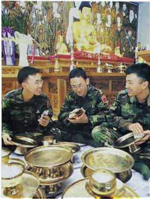
○27사단 군중병들이 호국대성사 설법전에서 정담게 대화를 나누며 설거지를 손질하고 있다.