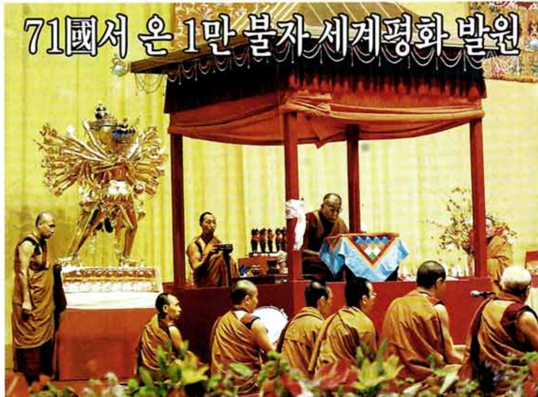
13일 달라이라마가 '만다라의 집'을 향해 경전과 계승, 진언을 영송하면서 칼라차크라 준비의식을 집전하고 있다. 달라이 라마는 하루 3시간 30분씩 설법하며 칼라차크라 입문에 필요한 참가자들의 덕성 함양을 위해 원력을 쏟았다.

달라이 라마에 의해 매년 개최되는 세계 최대 불교 의식의 하나인 칼라차크라라는 범어(梵語)로 시간(Kala)과 바퀴(Cakra)의 합성어. '영원한 시간의 수레 바퀴'라는 뜻으로, 전 세계 티베트 불교 신도의 기도와 염원이 실려 있다.