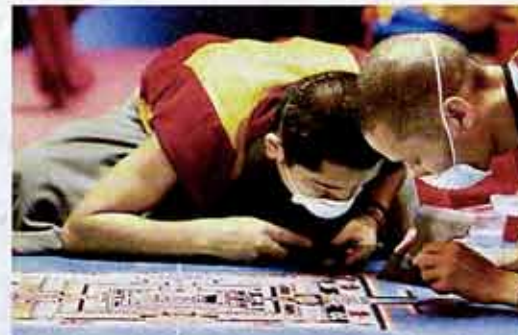
가는 모래로 만다라를 조성하는 스님들