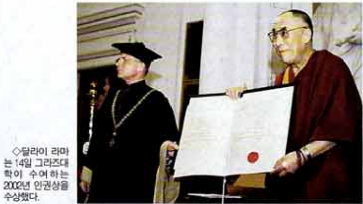
달라이 라마는 14일 그라즈대학이 수여하는 2002년 인권상을 수상했다.