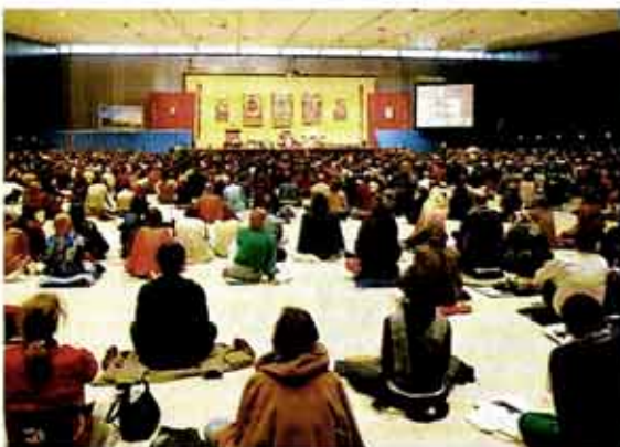
그라즈시 시립회관에 마련된 대법장에서 불자들이 달라이 라마의 설법을 경청하고 있다.

미국의 뉴욕, 로스앤젤레스, 시드니에서 개최된 후 유럽에서는 리본과 바르셀로나에 이어 3번째로 열린 이번 행사를 위해 오스트리아 스타이리아주 왈트라우드 크라스트닉 지사와 그라즈시의 알프레드 스텐글 시장은 1만2000㎡ 규모의 새로운 시립회관을 건립하는 등 적극적인 후원에 나서 대회가 원만히 봉행됐다.