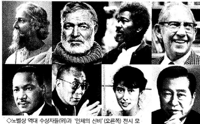
노벨상 역대 수상자들(위)과 '인체의 신비' (오른쪽) 전시 모습.

가을을 맞아 자녀와 함께 볼만한 문화 프로그램이 풍성하게 열린다. 어린이들에게 체험학습의 기회를 제공하는 전시회 세 곳을 소개한다. 호암재단(이사장 이현재)과 스웨덴 노벨재단 공동주최로 11월 3일까지 서울 태평로 로망갤러리에서 열리는 '노벨상 100주년 기념전'은 2001년 노벨상 제정 1백돌을 기려 열렸던 세계 순회전이다. 지난해 스웨덴 스톡홀름에서 시작해 노르웨이, 일본에 이어 해외에서는 세 번째로 우리나라에서 열린다. '창조성의 문화(Cultures of Creativity)-개인과 환경'