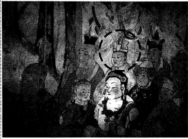
◇동화책 237호 벽화에 나타나는 한국인상. 오른쪽 위에서 두번째가 신라식 조우를 쓴 신라사신으로 추정된다.

한반도의 동남쪽에 있는 작은 나라였지만, 동아시아뿐 아니라 서역까지 그 활동영역을 넓힌 신라. 백제와 고구려를 멸망시킨 신라가 8-9세기 아시아에서 어떤 위치를 차지했는지를 조명한 공동연구집이 단행본으로 묶여 나왔다.