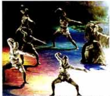
제8회 전국무용제에서 문광부 장관을 받은 카르마의 한 장면.

"전통 소리, 의상, 몸짓, 조명이 어우러진 가운데 한국의 혼과 정신을 느낄 수 있는 무대가 될 것입니다." 선수단을 포함한 4천여 명의 인원이 동참하는 아시안게임 폐막식 공연 '세계로 가는 기차' 마지막 무대 안무를 맡은 이명미(우바이무용단 안무가. 43)씨는 학