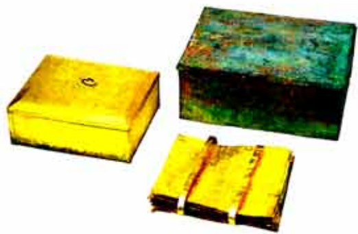
▷전북 익산 왕궁리석탑에서 출토된 국보 123호 금강경 순금경판