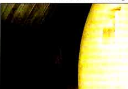
▷피라미드인 거실 및 황토 돐의 구조

피라 황 토 시공 문의: 황토건축가 안진건 017-585-6045 011-9547-4741