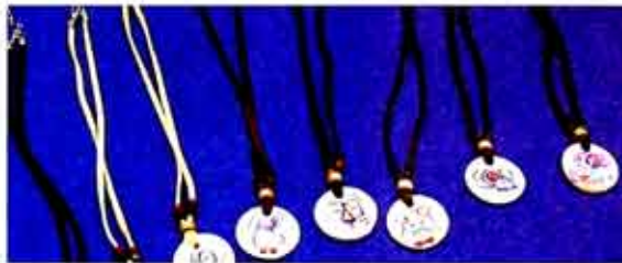
▷12간지 띠별 목걸이