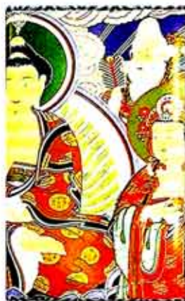
▷불화를 컬러이메징한 지갑

기부터 전성기, 그리고 말기의 과정을 파악할 수 있게 했다. 특히 국내에서 주목받지 못했던 40여점의 목간(木簡, 나무조각에 쓴 일종의 문서를 비롯해 지방민 봉지 과정 등 파악할 수 있는 보물 516호 대구무술명오자비, 경주남산신성비 등의 유물이 확보와 함께 전시된다. 또한 일부만 일반에 공개됐던 흥덕왕릉비린, 전북 익산 왕궁리석탑에서 출토된 금강경 순금경판(국보 제123호), 신라백제서대방공불화엄경(국보 제196호) 등도 전시되어, 신라의 불교가 각종 경판과 탐비 등에서 다양한 불교 문자 문화를 꽃피웠음을 살펴볼 수 있다.(054-740-7538