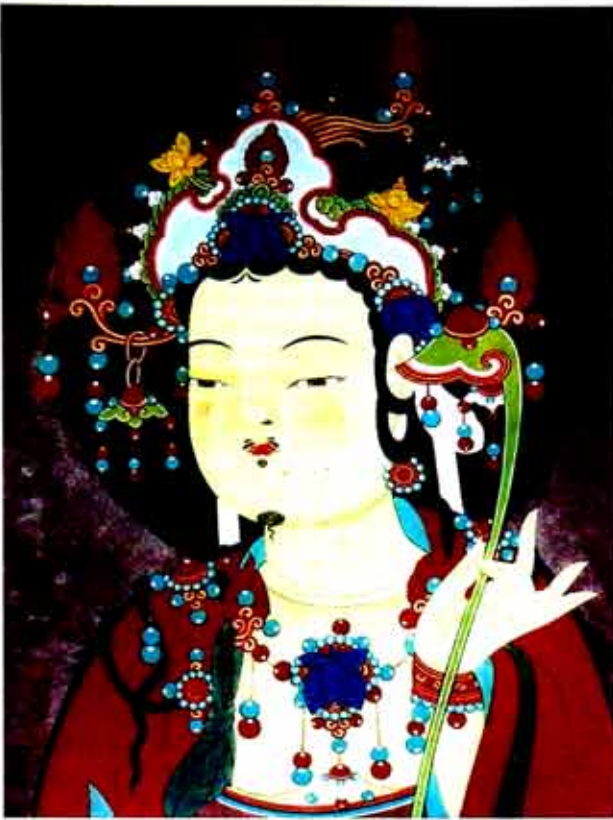
▷사자는 허산석 작 '문수보살'