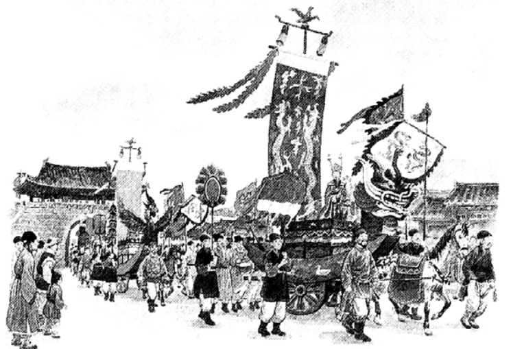
○음력 11월 15일, 팔관회 행사에 앞서 노래와 춤을 선보일 선량(仙良)이 용·봉황·코끼리 등으로 꾸민 수레를 타고 개경의 큰 길을 행진한다.