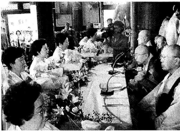
23일 남양주 봉선사 우란분절 '사은법회'에서 '우란분공양'을 올리는 신도들.

23일 남양주 봉선사(주지 일면, 불교의 '효'의 날인 우란분절 법회에 동참하기 위해 신도들의 발걸음이 바빠졌다.