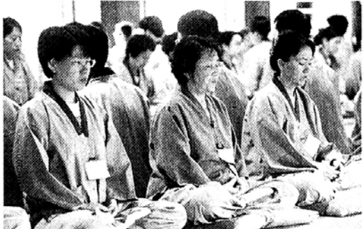
여름수련회에서 참선정진으로 일상에 찌든 몸과 마음을 추스리는 불자들. 사진은 해인사수련회.

무더운 날씨에 몸도 마음도 지쳤다. 한해의 반을 훌쩍 넘은 이맘 때쯤이면, 새해에 다짐하고 계획했던 일들이 하나둘씩 꼬리를 감추기 쉽다.