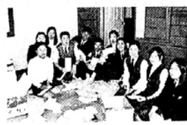
◇하남고 학생들이 자원봉사를 하고 있는 모습.

■능인사회복지관 ‘청소년자원봉사캠프’ = 일본군 위안부 할머니에게서 배우는 뼈아픈 역사의 교훈. 능인사회복지관이 경기도 광주 나눔의 집을 찾아가 자원봉사를