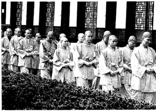
◇모든 인욕행의 근본은 하심하는 마음에서부터 시작된다. 언제나 하심하는 마음으로 처수(又手)하며 걷는 행자들

‘下心’ 아래 하 마음 심. 한문을 막 배우기 시작하는 아이들에게 물어 보아도 누구나 대답할 수 있는 쉬운 한자다. 하지만 이 두 글자를 실천하는 일은 결코 쉬운 일이 아니다. 갖 사발한 행자들이 처음 시작하는 공부가 하심 공부일 정도로. 수행의 처음과 끝이라 해도 과언이 아니다. 행자들은 선배들로부터 “스님 생활 잘 하려면 하심부터 배워야 한다”, “무조건 하심해라”, “아만(我慢)부터 버려라”는 말을 수없이 듣는다. 모든