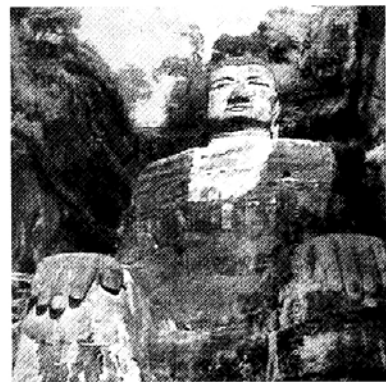
◆중국 사천성 민강의 절벽에 세워진 낙산대불은 지난해 3월 달라이 라마 14세 대법회 당시 파파인 아프가니스탄의 바미안대불보다 키가 16m 더 크다.

이라고, 칼라차크라 그라즈 2002 준비위원회가 최근 밝혔다. 이번 칼라차크라 대법회는 그라즈시의 초청과 오스트리아 유네스코 및 오스트리아불교협회의 후원으로 개최된다. 오스트리아 정부 및 스타이리아 주정부도 행