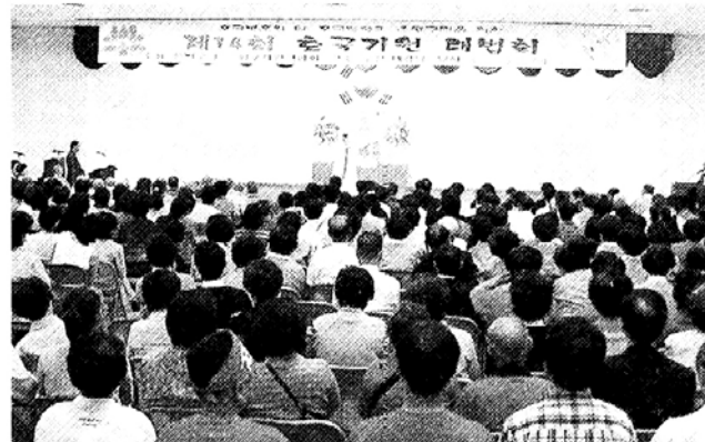
◇서울 은평구청 불심회와 은평구불교사원연합회 주최로 6월25일 은평구청 대강당에서 열린 호국기원대법회 모습.

이번 수계의식의 계사로는 조계종 총무원 총무국장 덕신스님이 나서며, 이날 법회에는 한국은행, 산업은행, 서울은행, 우리은행 불자회 등 금융단 불자 50여명이 참석할 예정이다. 이탁수 회장은 "바쁜 일상생활에서 벗어나 고요한 산사에서 자신의 삶을 돌아보고, 묵은 때를 벗어 버리고 새로운 마음과 정신을 가다듬는 자리가 될 것"이라며 "진심한 불자로 살아가겠다