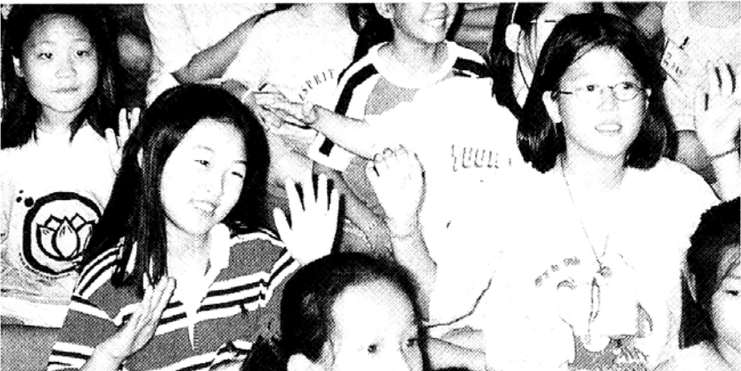
이달에 7월 열렸던 제4회 부다피아어린이여름캠프에 참가한 새싹불자들이 울동을 배우고 있는 모습.

무더운 여름, 새싹불자들만을 위한 신나는 여름방학캠프가 어린이들을 기다린다. 현대불교신문사가 주최하고 불교레크리에이션협회(회장 윤광)가 주관하는 제5회 부다피아어린이여름캠프가 '자연과 함께, 마력부처님과 함께'란 주제로 7월 30일부터 8월 1일까지 법주사의 유스타운, 속리산 국립공원 일대에서 열린다. 해를 거듭할수록 프로그램이 다양해지고 있는 부다피아어린이캠프는 자연현장 체험을 바탕으로 한 심성개발 프로그램에 비중을 뒀다는 점에서 종교와 관계없이 참여할 수 있는 '어린이 포교의 새로운 모델'로 평가받고 있다.