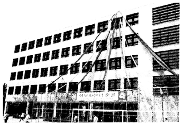
6월 21일 준공된 동대부고 '정보화센터' 건물 전경.