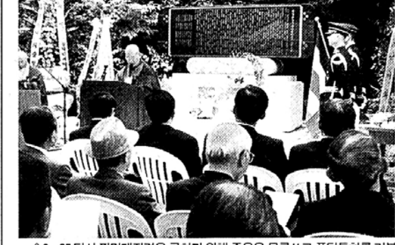
○6·25 당시 팔만대장경을 구하기 위해 죽음을 무릅쓰고 폭탄투하를 거부한 김영환장군을 기리는 공적비가 17일 제막됐다.