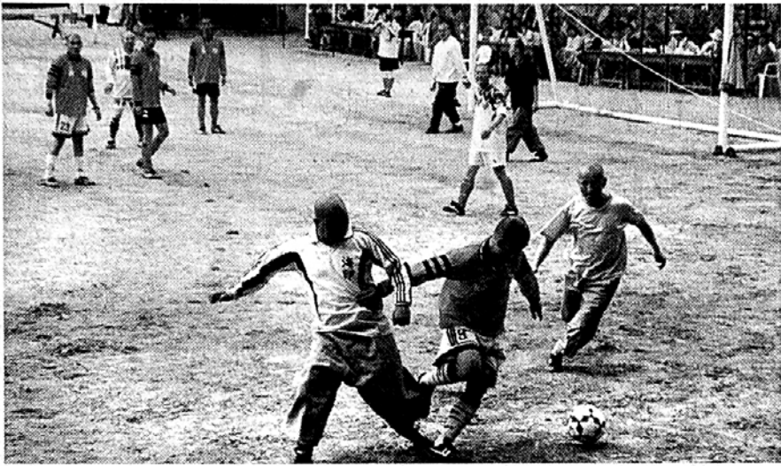
해인사 강원훈생팀과 중무소팀의 해인사 축구대회 경기모습.