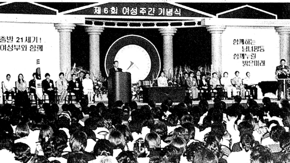
◇'여성주간'이 전국적인 축제로 자리잡아가고 있다. 사진은 지난해 열린 '6회 여성주간' 기념식 장면.

제7회 여성주간이 '여성의 힘, 국가 경쟁력의 시작입니다'라는 슬로건을 내걸고 7월 1일부터 7일까지 다양한 행사를 준비하고 있다.