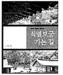
적멸보궁 가는 길

"적멸보궁 가는 길은 내가 무엇을 '찾으면서' 가는 길이 아니라 내가 무엇이 '들키면서' 가는 길이였다. 길 위에서 타인의 발자국에 들키고, 지우지 못한 내 발자국에 또 들키고, 뾰족한 돌부리에 모서리 같은 내 마음이 들키고..."